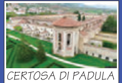
CERTOSA DI PADULA