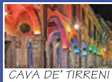
CAVA DE' TIRRENI