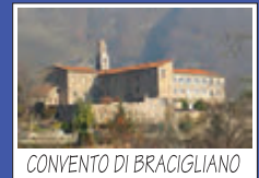
CONVENTO DI BRACIGLIANO