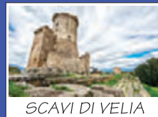
SCAVI DI VELIA